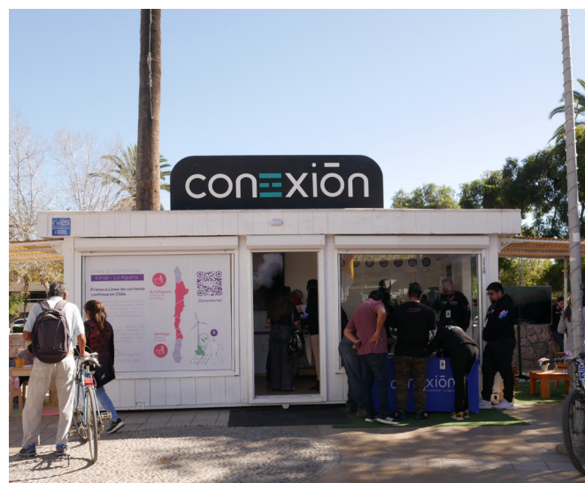
Casa Abierta Atacama - Inca de Oro y Vallenar