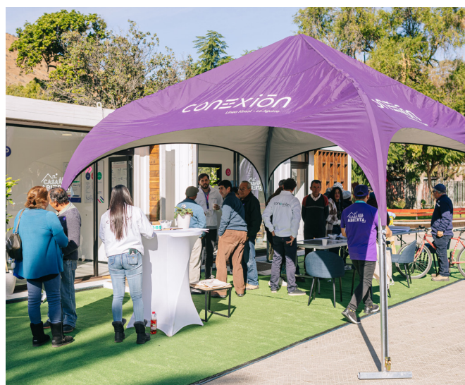
Casa Abierta Valparaíso - Catemu, Panquehue y Cabildo

El proyecto incorpora el Acuerdo de Escazú, desde iniciado su relacionamiento con comunidades indígenas y no indígenas en junio de 2022, garantizando así el derecho a todas las personas a tener acceso a la información relacionada con el proyecto de manera oportuna y adecuada.